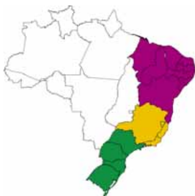
I II e III trimestres