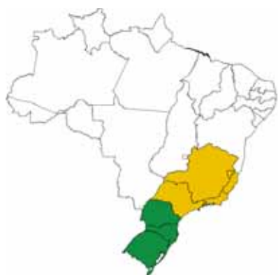
I e II trimestres