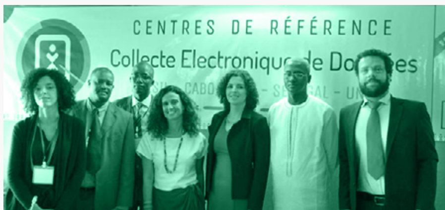
Senegal foi o primeiro dos dois países africanos a receber capacitação

cooperação brasileira tem-se caracterizado por ser trilateral, por ser formada pelos países envolvidos e uma instituição que colabora e entra como parceira. No caso dos censos, nosso parceiro é o FNUAP, como nos centros de referência”, destaca Roberto.