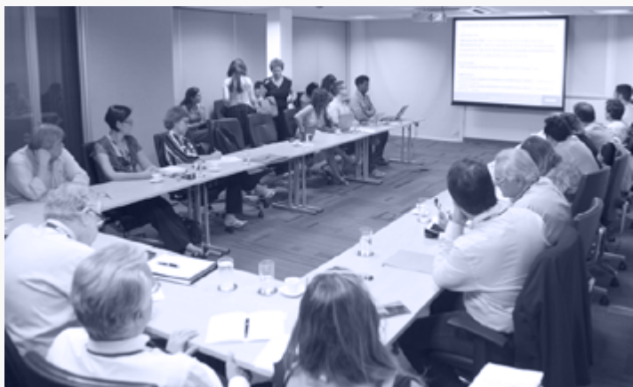
Reunião discutiu prioridades para a área de Relações Internacionais em 2018