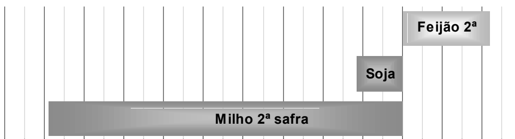
Variação da produção - comparação março-abril 2005 - BRASIL

A variação positiva verificada na estimativa de produção do feijão 2ª safra, deve-se às primeiras informações do estado da Bahia, o qual apresenta para esta temporada, acréscimos de 38% na produtividade e 31% na produção esperada, embora a área plantada apresente diminuição de 5% em relação ao mês de março. Mato Grosso do Sul e Rio Grande do Sul, também importantes produtores de feijão, apresentam decréscimos de 49% e 12% nas suas produções, respectivamente, devido às fortes estiagens ocorridas nos principais municípios produtores.