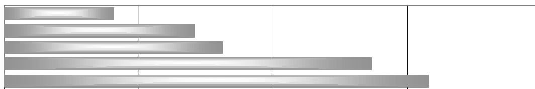
Varição da produção - com comparação maio-junho 2001

O acréscimo verificado na estimativa de produção do algodão herbáceo, é proveniente de novas informações dos estados de São Paulo e Goiás, que apresentam ganho de produtividade, em relação a última informação, de 13,06% e 6,41%, respectivamente.