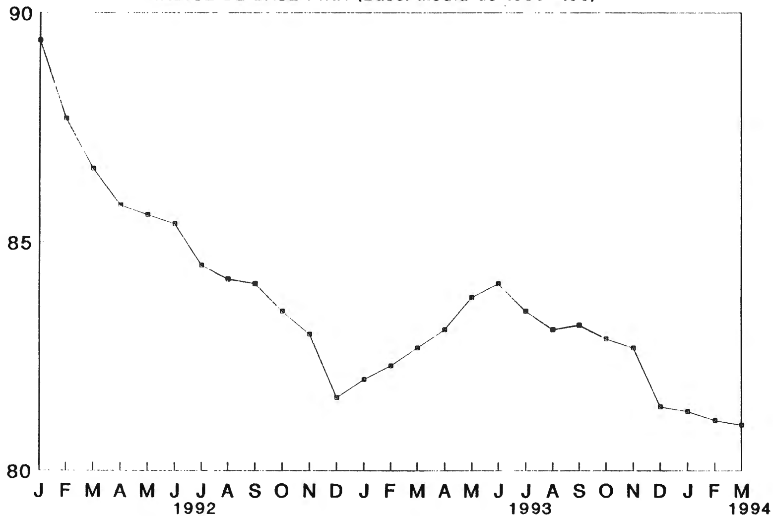
GRAFICO 1 EVOLUCAO DO NIVEL DE EMPREGO INDUSTRIAL INDICE DE BASE FIXA (Base: media de 1985 =100)