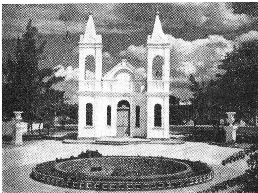
Igreja de Santo Antônio. No primeiro plano, a fonte luminosa.

voura, 6, indústria, 5, e particulares, 3); depósitos à vista e a curto prazo, 131; e depósitos a prazo, 3.