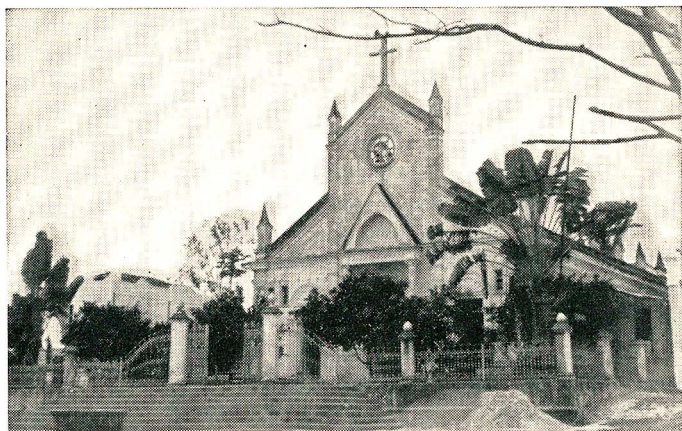
Igreja Matriz de São João

No setor da assistência médico-sanitária, a população conta com a Maternidade Municipal Dulce Garcês (12 leitos), 2 Postos de Saúde, 1 Centro de Puericultura. Exercem a profissão, 3 médicos, 3 dentistas e 1 farmacêutico. Há, ainda, 2 farmácias.