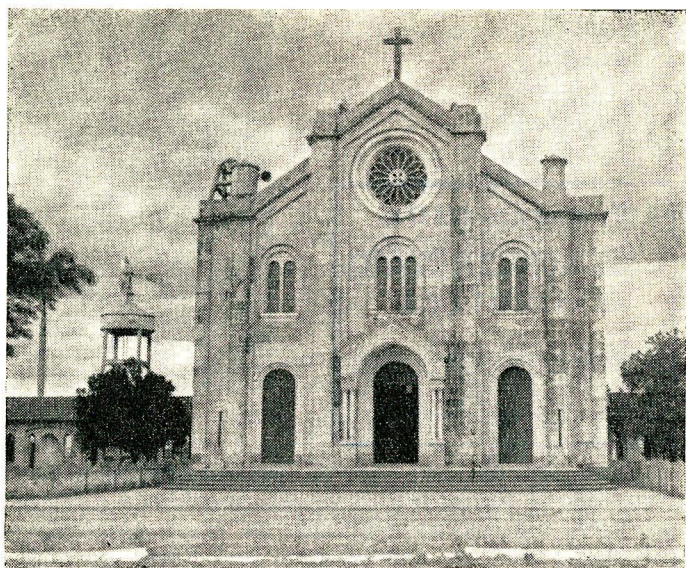
Igreja Matriz de Santo Afonso

tório Federal de Ponta Porã, reincorporando-se ao Estado de Mato Grosso em 18 de setembro de 1946, quando foi extinto o Território. Em 1948, conta com 3 distritos: da sede, Caracol e Jardim, e em 1958 foi-lhe acrescido o de Campestre.