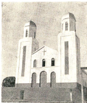
Matriz de São Gonçalo

O Censo Industrial de 1960 cadastrou 3 estabelecimentos, que utilizaram