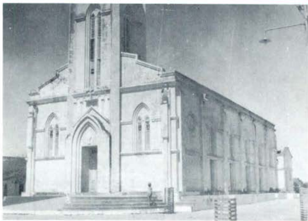
Igreja de N. S. do Rosário

SEGUNDO o IX Recenseamento Geral do Brasil, contavam-se 6.580 católicos e 6 protestantes. Os demais se omitiram.