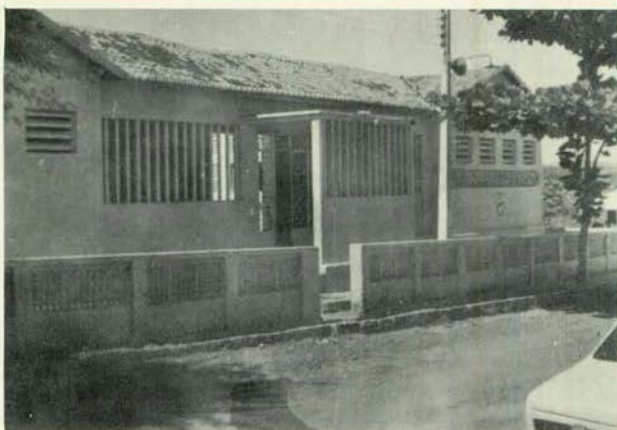
Colégio Padre Manoel Otaviano