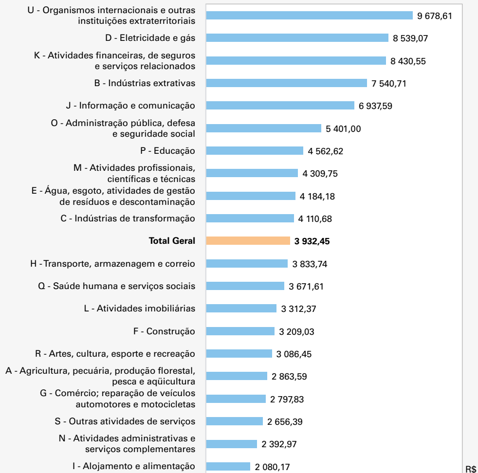
Gráfico 1 - Salário médio mensal, em ordem decrescente, segundo as seções da CNAE 2.0 - Brasil - 2024